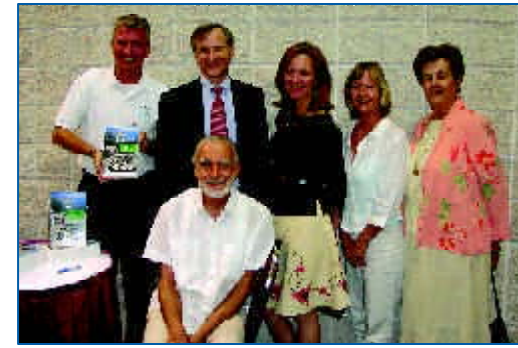
Cada uno de los oradores de la Celebración ofreció detalles acerca de la forma en que debe proseguir la designación de "carretera panorámica"

El 24 de abril de 2006, el personal de la MPO del Condado de Broward organizó una recepción especial en el Centro de Convenciones del Condado de Broward para celebrar la conclusión y aprobación de los requisitos de la Fase de Elegibilidad para la designación de "Carretera Panorámica" para la Vía Estatal A1A. El hermoso tramo de 32 millas que se extiende desde la demarcación entre los condados de Broward y Palm Beach, hasta la de los condados de Broward y Miami-Dade, sirve de corredor de transporte multimodal para el condado.