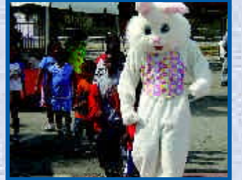
Los niños se divertieron de lo lindo con las actividades del Lauderhill Spring Fling.