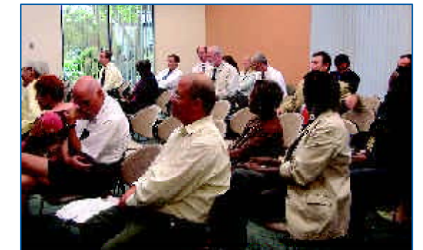
Los miembros del público escuchan mientras se abordan los aspectos en agenda durante la Reunión Regional del Comité Asesor de Ciudadanos, celebrada el 14 de junio.

La reunión se realizó entre las 4:00 p.m. y las 6:00 p.m., y varios participantes del público cuestionaron al comité, así como a los oradores. Los miembros del Equipo de Proyecto Gannett Fleming respondieron numerosas preguntas relacionadas con la SFECCTA. Este estudio regional está financiado por las MPO (Organizaciones de Planificación Metropolitana) y encabezado por el Distrito IV del Departamento de Transporte de Florida para desarrollar y analizar las alternativas que potencialmente integren el transporte