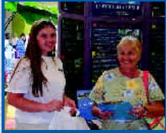
Los miembros del personal de la MPO ofrecieron al público detalles sobre el proceso de planificación del transporte.