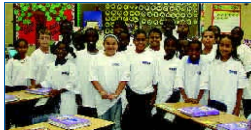
Los estudiantes de la escuela Morrow Elementary sorprenden al personal de la MPO luciendo sus camisetas de la MPO durante su segunda visita a la escuela.

En el 2004, la MPO del Condado de Broward produjo un exitoso programa piloto destinado a llegar a los estudiantes de escuela primaria, así como a sus padres y tutores, centrado en la planificación del transporte y la importancia que reviste la participación de la comunidad en dicho proceso. Desde la presentación inicial, en la escuela Dillard Elementary, el personal ha introducido el programa en 12 escuelas primarias del Condado de Broward.