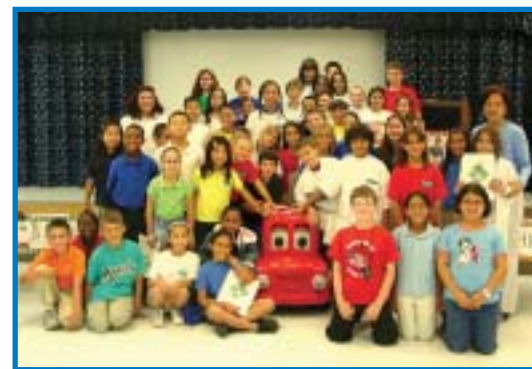
¡Todos los alumnos de la escuela primaria Lakeside aman a Buddy!

El Programa Outreach Piloto se inició en el 2004, en la Escuela Primaria Dillard. Desde ese entonces, la MPO