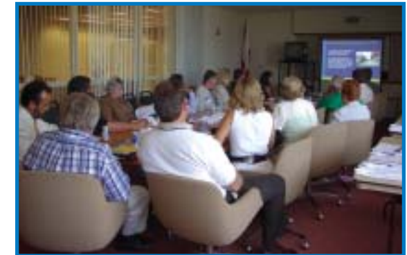
Líderes de opinión, tales como comisionados, alcaldes, directores de grupos culturales, propietarios de negocios y empleados condales y de ciudades participan en la actividad "Lunch N' Learn".

Para más información sobre esta serie de eventos, visite www.broward.org/mpo .