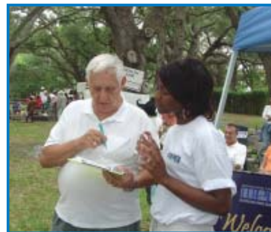
El personal de la MPO se encontraba atento a responder preguntas, mientras un participante llena una encuesta sobre el transporte.

El pasado mes de mayo, la MPO del Condado de Broward participó en el 4to. Festival Anual de la Diversidad, en Davie, como parte de un esfuerzo sistemático para atraer e instruir a la comunidad acerca de las MPO. El festival se celebró en el Robins Open Space Park, con quioscos y vendedores reunidos bajo los frondosos árboles del parque. El festival contó con la música de agrupaciones locales, demostraciones instructivas sobre karate y danza árabe, así como actividades para niños.