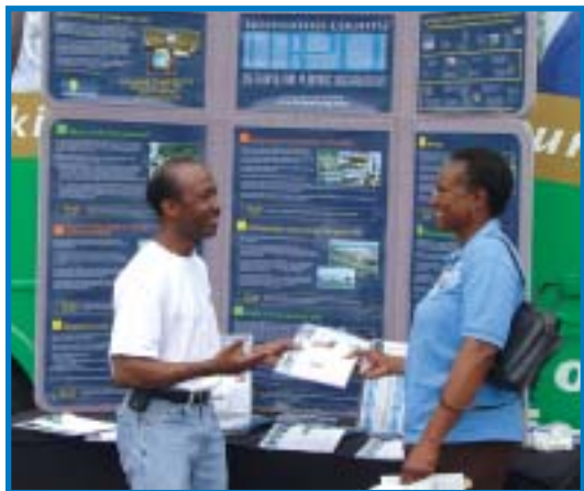
La MPO estuvo presente con su Estación de Información Móvil.

Para obtener más información sobre la forma de participar, visite www.broward.org/mpo o comuníquese con el personal de la MPO en el (954) 357-6608.