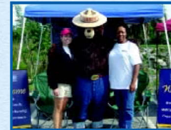
Smokey the Bear (Konpè Lous) te vin aprann moun kouman pou yo anpeche dife pran nan rakbwa